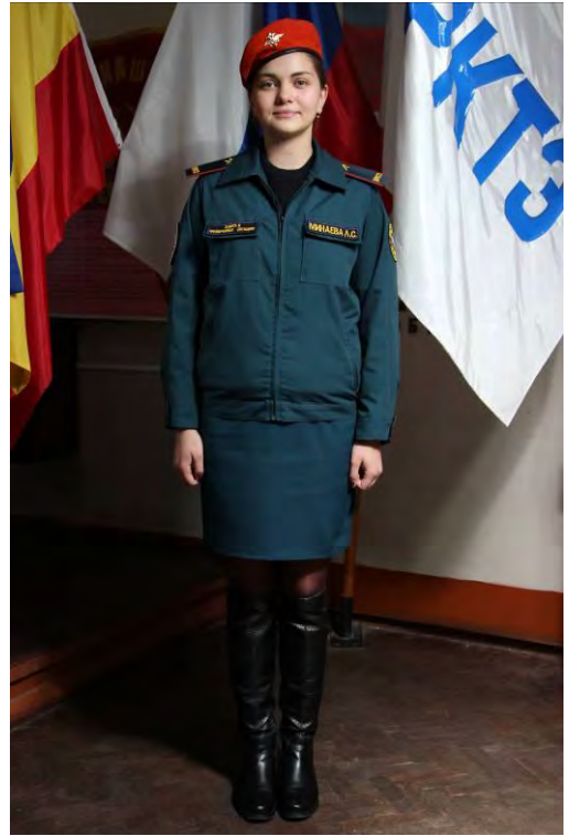
Вариант №5 - брюки (юбка) и майка, свитер, куртка с длинным рукавом в берете