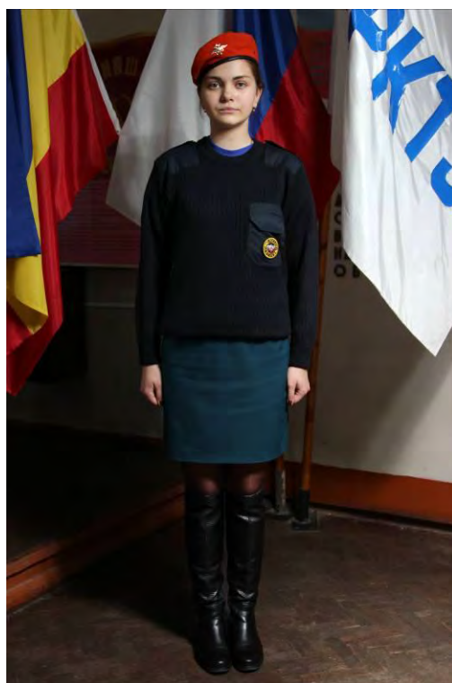
Вариант №4 - - брюки (юбка) и майка, свитер без берета (в берете)