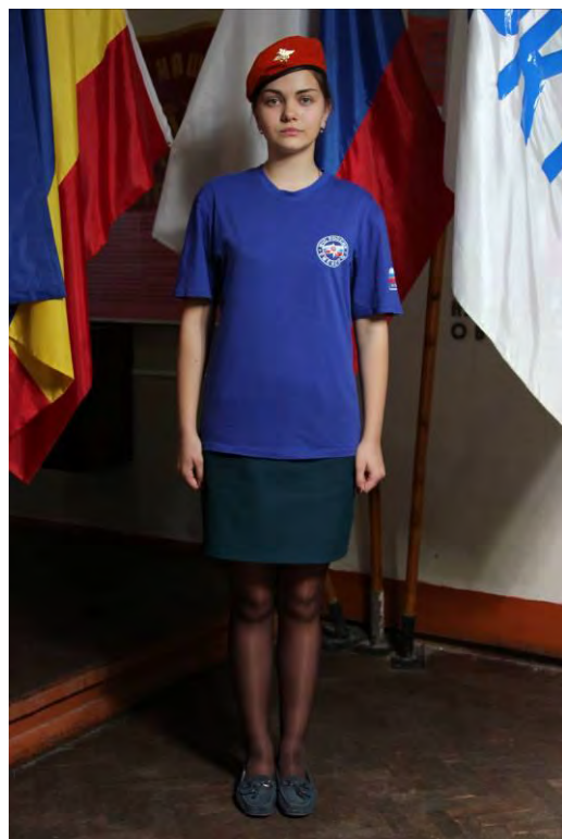
Вариант №1 - брюки (юбка) и майка с коротким рукавом без берета (в берете)