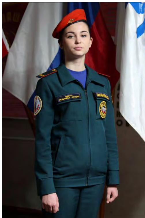
Вариант №3 - - брюки (юбка) и майка, куртка с длинным рукавом в берете