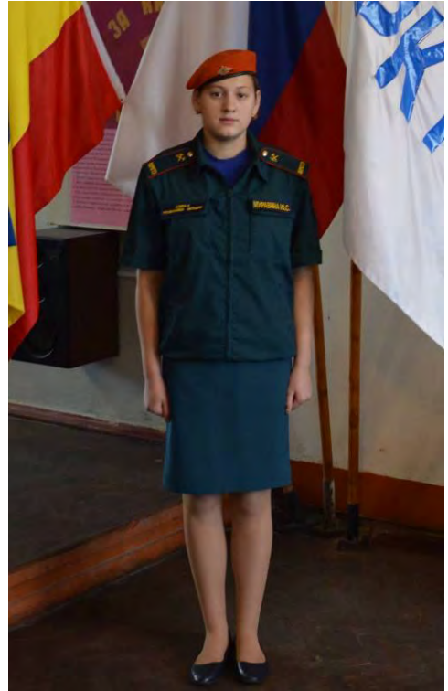
Вариант №2 - брюки (юбка) и майка с коротким рукавом, куртка с коротким рукавом в берете (без берета)