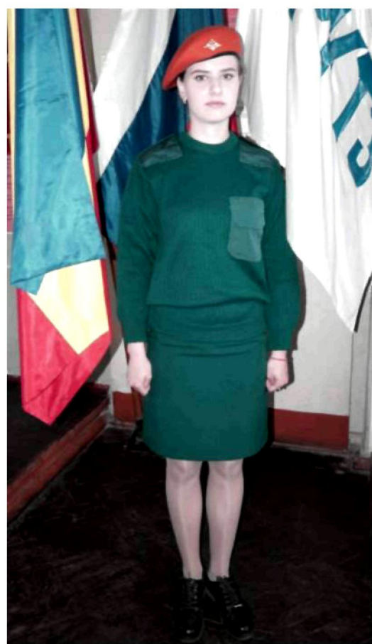
Вариант №4 - брюки (юбка) и майка, свитер без берета (в берете)