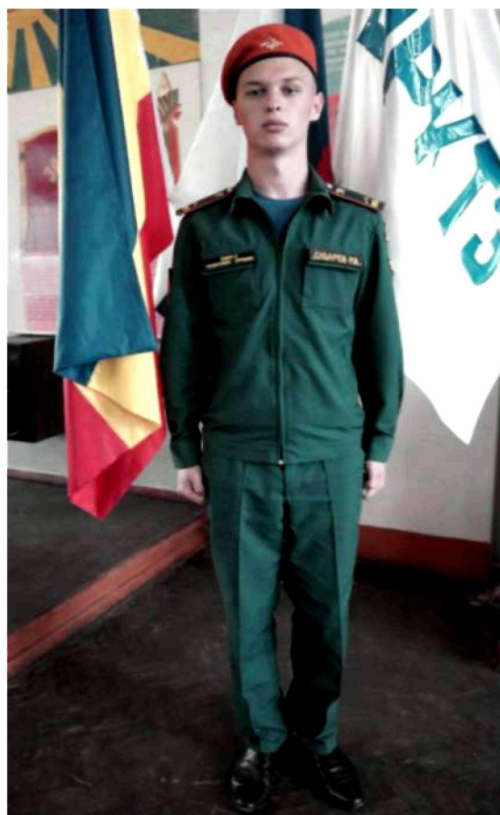
Вариант №3 - брюки (юбка) и майка, куртка с длинным рукавом в берете