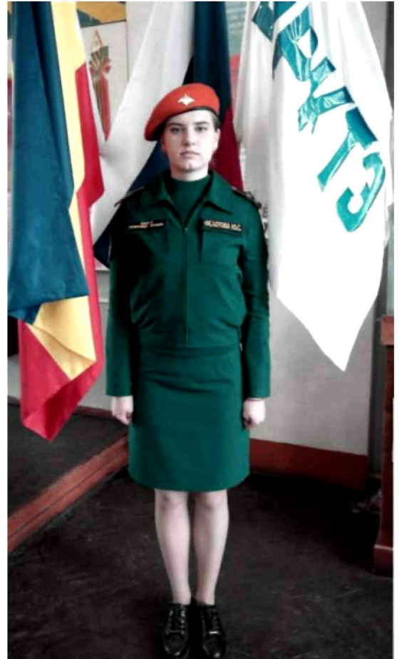
Вариант №5 - брюки (юбка) и майка, свитер, куртка с длинным рукавом в берете