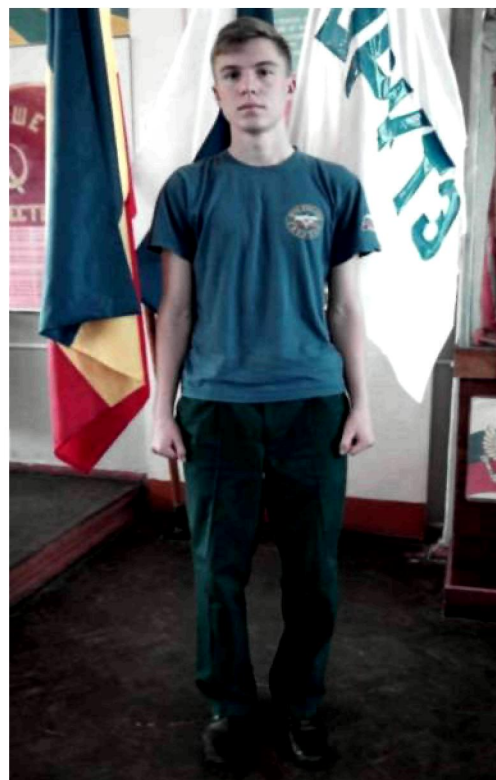
Вариант №1 - брюки (юбка) и майка с коротким рукавом без берета (в берете)