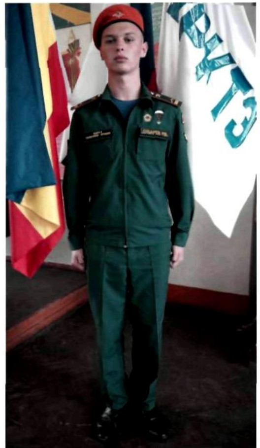
Пример размещения знаков отличия, нашивок, медалей и наградных знаков